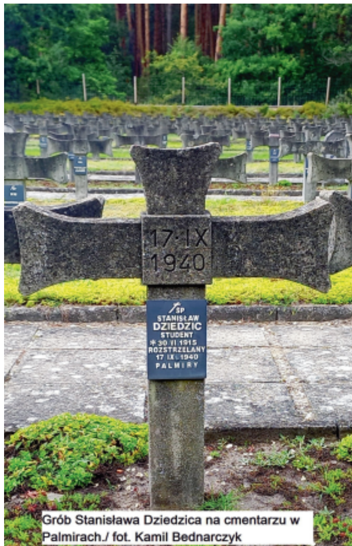
Grób Stanisława Dziedzica na cmentarzu w Palmirach

Nieopodal miejscowości Palmiry, w Puszczy Kampinoskiej, Stanisław Dziedzic został rozstrzelany. Jego szczątki zostały odkryte w jednej z ekshumacji dokonanych po wojnie. Zostały złożone nieopodal miejsca zbrodni, na założonym w 1948 r. cmentarzu.