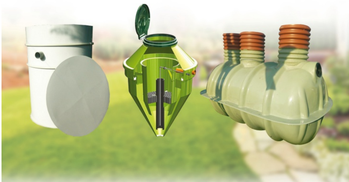
OCZYSZCZALNIA BIOLOGICZNA IV (do 30 RLM)